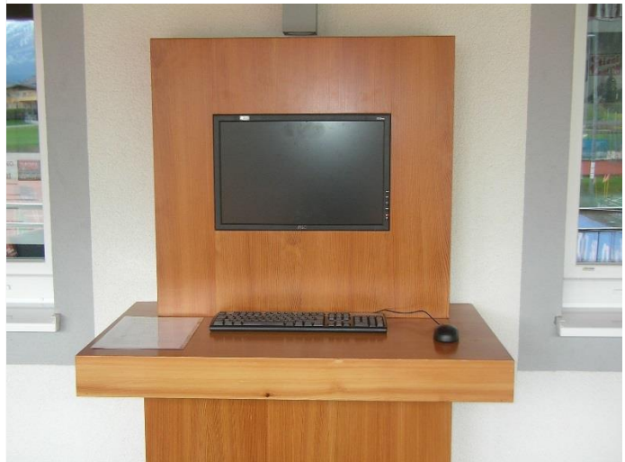
Terminal Sportheim Terrasse